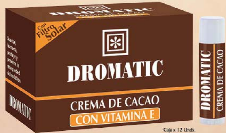
Caja x 12 Unds.

Enriquecida con Vitamina E que nutre, suaviza, humedece y ayuda a aliviar la resequecedad de los labios dejándolos suaves, brillantes y delicados. Contiene filtros solares UVA y UVB para proteger sus labios de los nocivos rayos del sol.