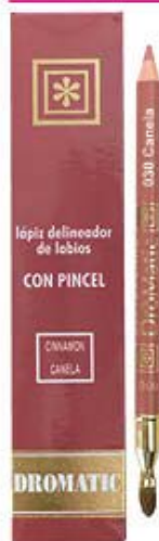
Láplz delineador de labios con pincel