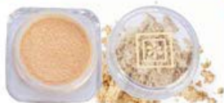
Sombra en Polvo Nacarada