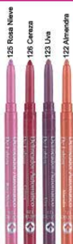
Delineador automático de labios Köhler