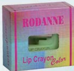
Sacapuntas Crayón Colores