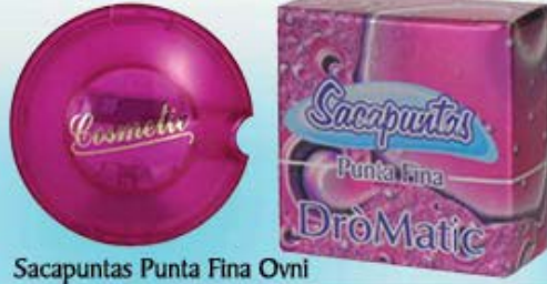
Sacapuntas Punta Fina Ovni