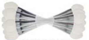
Aplicadores de sombra x 6

Haz clic el color de la sombra cambia cuando lo seleccionas en la LUV