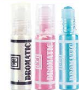
Sombra Roll-on Nacarada