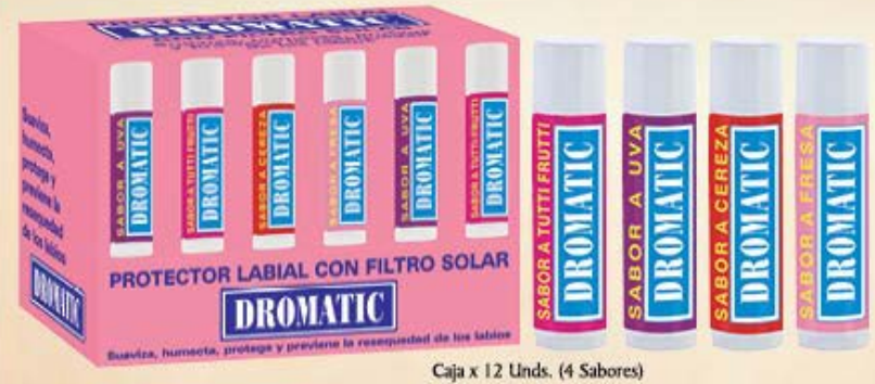
Caja x 12 Unds. (4 Sabores)

Lubrica y suaviza los labios previniendo el daño causado por los rayos solares, el viento o el frío. Su fórmula con ingredientes naturales y filtro solar previene la resequecedad en los labios, y los mantiene suaves, húmedos, brillantes y protegidos.