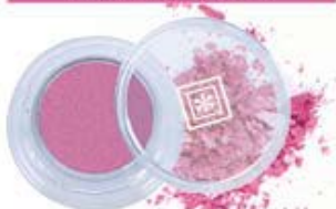
Sombra Compacta Nacarada - Mate